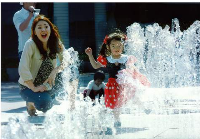
作品名「いたずらっ子」 鈴木康之 様