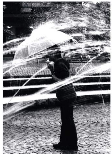
作品名「水勢」 中孝夫 様