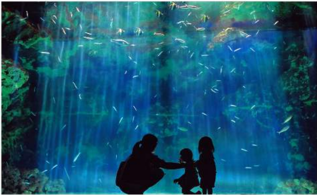
作品名「親子の絆」 中川秀男 様