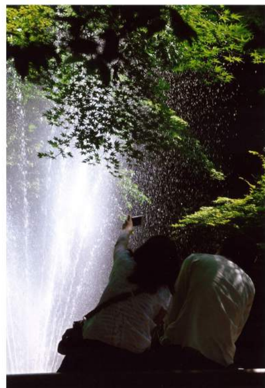
作品名「二人の世界」