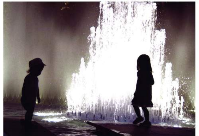
作品名「渡れない」 飯田芳正 様